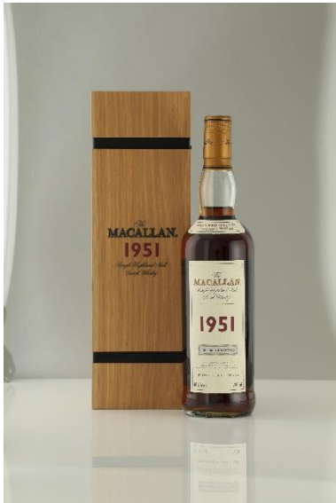
麥卡倫 珍稀系列 1951