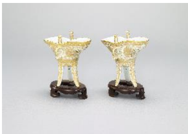
清乾隆 白地描金團龍紋爵一對 ①L:12.8cm W:6.7cm H:12.3cm 帶座 H:14.5cm ②L:12.9cm W:7.1cm H:12.4cm 帶座 H:14.6cm