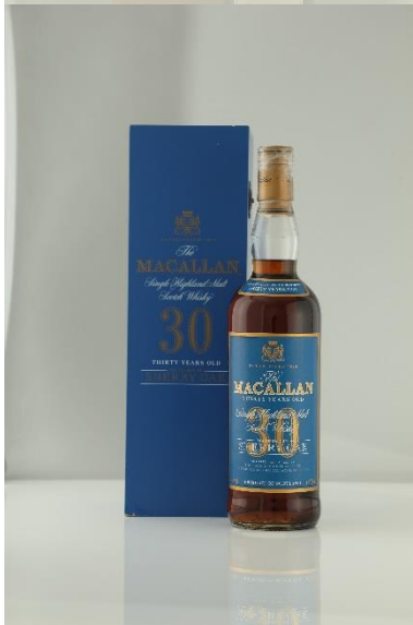
麥卡倫 30年 - 舊版藍木盒