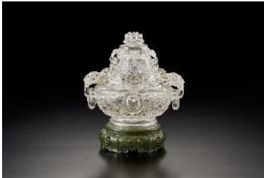
清乾隆 水晶香爐 水晶 H:15cm