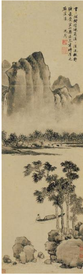
沈周（1427-1509）滄浪濯足圖 水墨紙本立軸 103x31 cm 約 2.9 平尺 264 X 80 cm