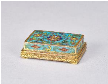
銅胎琺瑯彩墨床 銅器 L:5.5cm; W:4cm; H:2.6cm