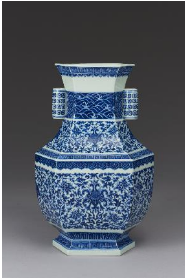
清雍正 青花纏枝番蓮紋六角形雙貫耳尊式瓶 L:27.5cm; W:19.5cm; H:44cm