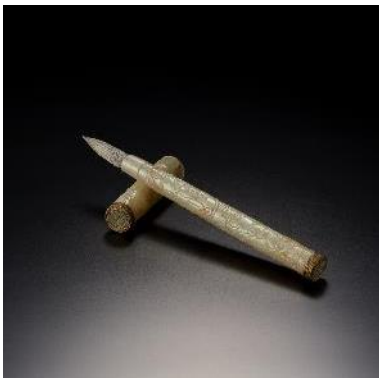
明 白玉雕花卉圖紋筆 玉 L:21cm