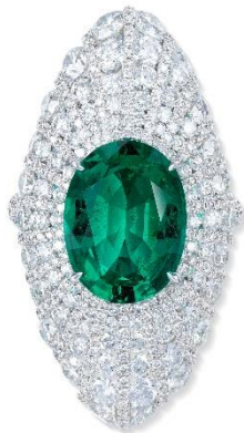
祖母綠配鑽石戒指