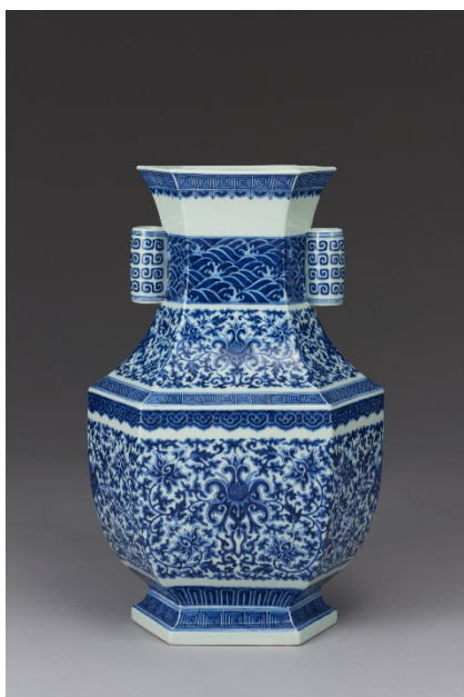
LOT 1133 清雍正 青花纏枝番蓮紋貫耳六方瓶 L:27.5cm;W:19.5cm;H:44cm 估價：HKD: 1,500,000-2,500,000