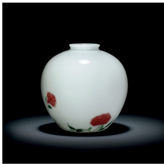
LOT 1136 清康熙 釉裡紅加彩花卉蘋果尊 估價: HKD 500,000-800,000 H:8.8cm ; D:9cm