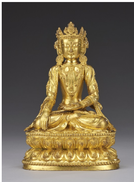
LOT 1130 明永樂 銅鎏金無量壽佛坐像 H:22.5cm 估價：HKD 1,200,000-1,500,000