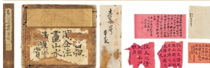
LOT 0035 藍瑛 (1585-1666) 《仿關仝山水》