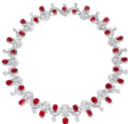
LOT 1238 紅寶石（鴿血紅）配鑽石項鍊

香港上環干諾道中111號永安中心26樓2601室 T +852 2805-9016 F +852 2805-9017 E info@chuo-auction.com.hk