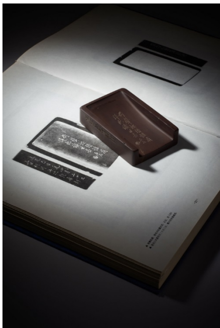
LOT 0820 沈石友舊藏鳴堅白齋填詞自用硯 L:11.5cm;W:8cm;H:2.5cm 估價：HKD 284,950-341,940