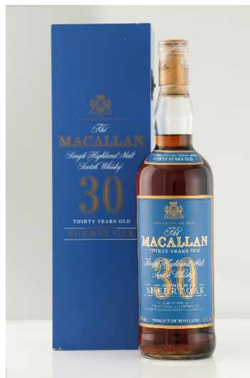
LOT 1254 麥卡倫 30 年 - 舊版藍木盒

總重約 87 克，長度 42 釐米 估價：HKD 3,800,000-4,500,000