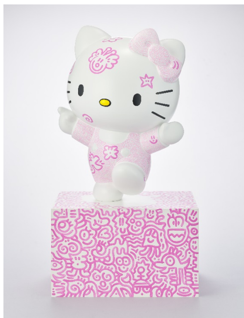
Lot 1232 Pink Cloud Kitty

塗鴉先生 (B.1994) 2019 年作 Acrylic on FRP 總高：93cm；本體高：63cm；台：40x50x30cm