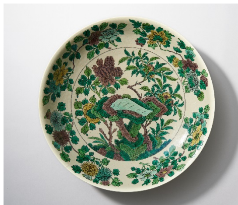
LOT 0745 清康熙 素三彩暗刻龍紋四季花卉紋 大盤

H:10.2cm;D:52.5cm 底款：大清康熙年製 估價：HKD 284,950-341,940