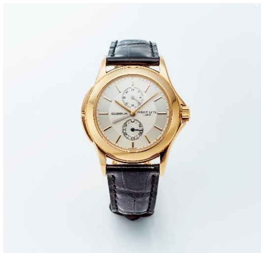
Lot 701 百達翡麗與古柏林的合作 150 週年限 量版 1854-2004 年 5134R 玫瑰金腕錶

錶徑：37mm 複雜功能時計系列 雙時區 玫瑰金黃金等總共 150 隻，玫瑰金約 40 隻。