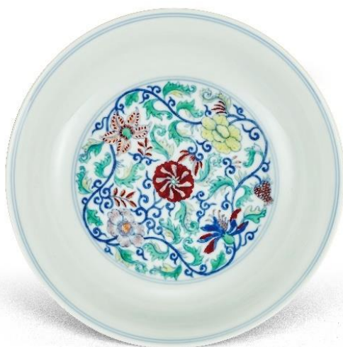
Lot 440 清雍正 鬥彩纏枝花卉紋盤

拍賣：7月14日（四）至15日（五） 開拍時間：上午11時（東京時間）、上午10時（香港時間） 地點：東京都中央区京橋3-7-5 2樓（現場拍賣） 香港上環干諾道中111號永安中心26樓2601室（直播、現場競投） 電子圖錄： https://tcabid.com/auctions/252