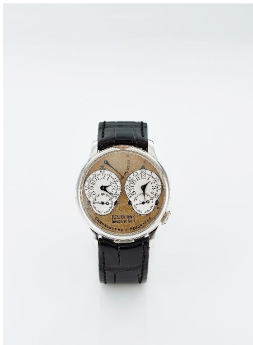
Lot 699 F.P. Journe Chronomètre à Resonance

估價： HKD：173,220-230,960 JPY：3,000,000-4,000,000 RMB：150,000-200,000